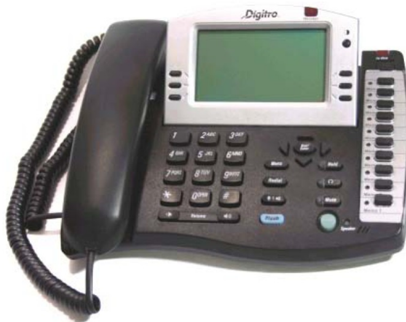
Figura 1. Telefone digital Digitro