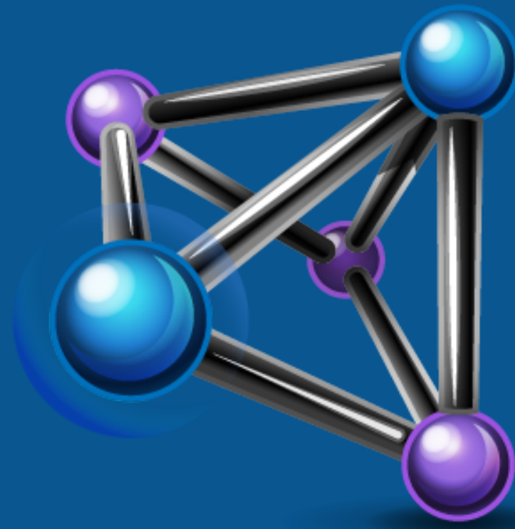
Gráfico de Chamadas